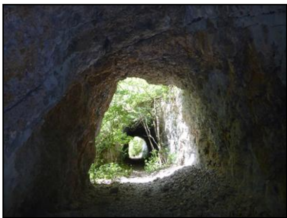
L'entrée vue depuis la sortie du tunnel de Chaley 2