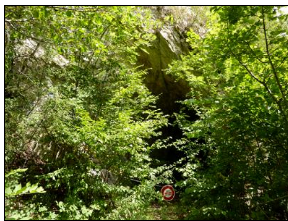
Et la sortie cachée par la végétation