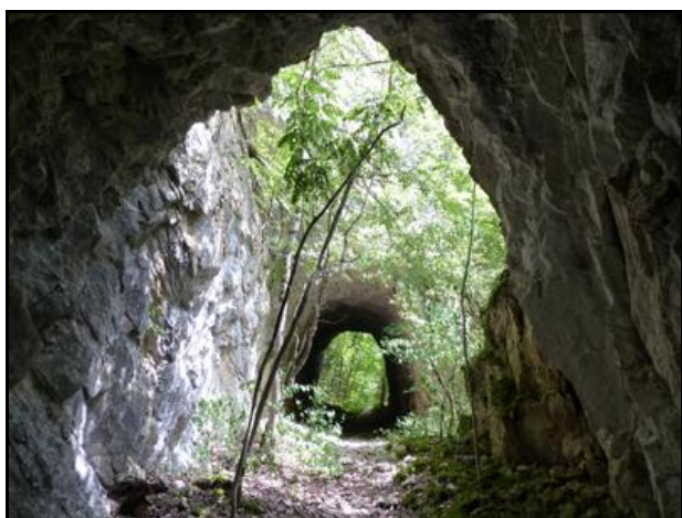
L'entrée vue à contresens avec le tunnel de Chaley 2