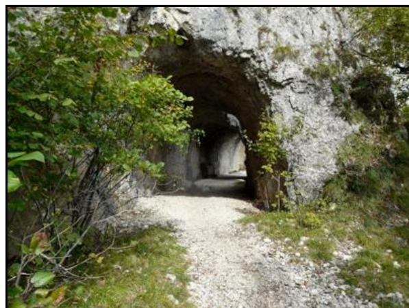
Les Cascades 1 depuis la sortie des Cascades 2