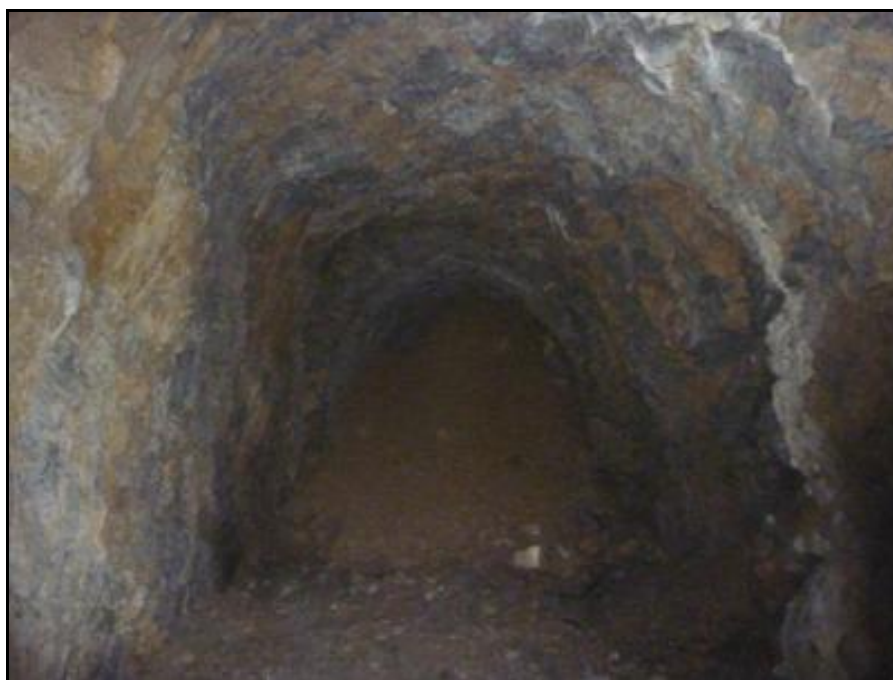
Ci-dessus et ci-dessous, l'éboulement vu de l'intérieur et depuis la sortie