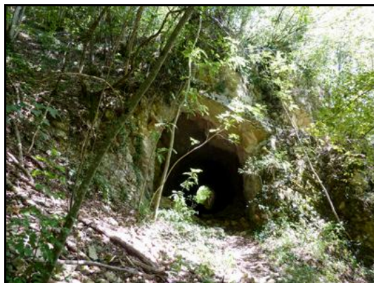
Ci-contre, l'entrée du temps du creusement du tunnel