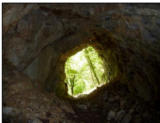
Deux aspects de la galerie en regardant vers la sortie

Si cette fiche comporte des erreurs ou des oublis, merci de nous le signaler.