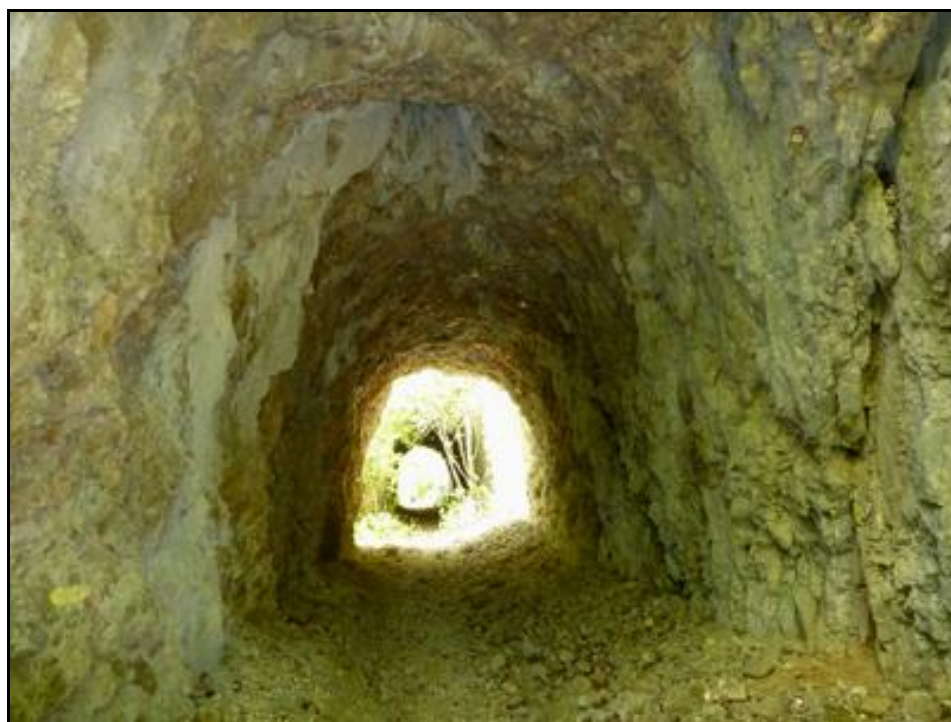
La galerie prise vers la sortie avec, à l'arrière-plan, le tunnel de Chaley 1

Si cette fiche comporte des erreurs ou des oublis, merci de nous le signaler.