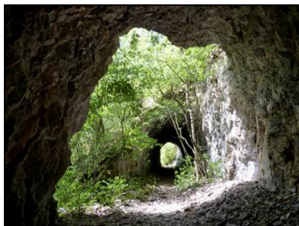
A droite, la sortie avec, à l'arrière-plan, le tunnel de Chaley 1