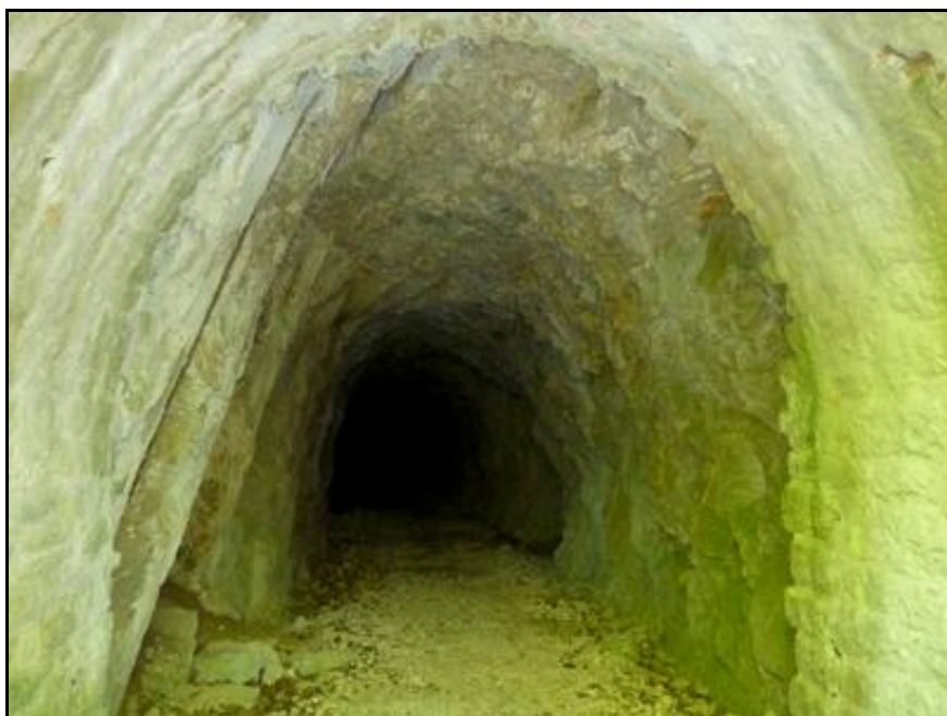
Ci-dessus et ci-dessous, la galerie en partie maçonnée