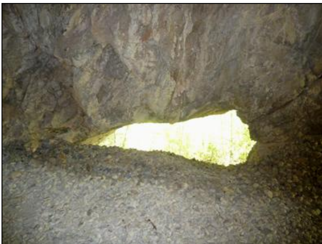
La fenêtre latérale partiellement comblée par du ballast

Si cette fiche comporte des erreurs ou des oublis, merci de nous le signaler.