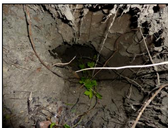
Deux vues du trou souffleur caché par la végétation qui masque le bouchon qui ferme la sortie

Si cette fiche comporte des erreurs ou des oublis, merci de nous le signaler.