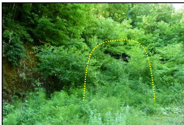
L'emplacement de la sortie du tunnel (pointillés)