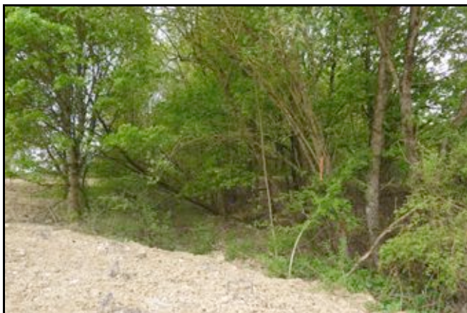
L'emplacement de l'entrée dont il ne reste rien