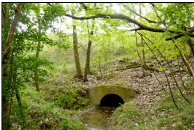
Côté nord, seul ce drain dénonce l'axe de l'ancienne galerie du tunnel