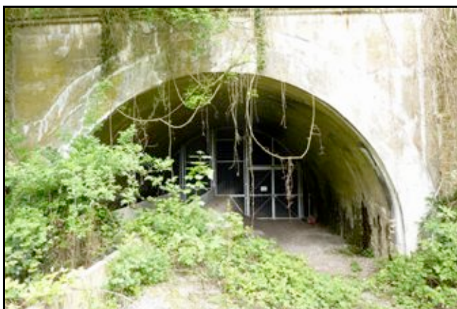
La sortie sud du tunnel, fermée