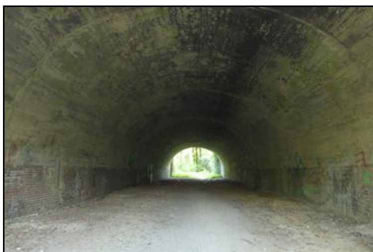
La belle et large galerie du faux tunnel actuel de Folembray