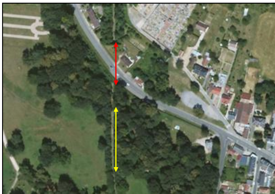
Vue aérienne des galeries de Folembray