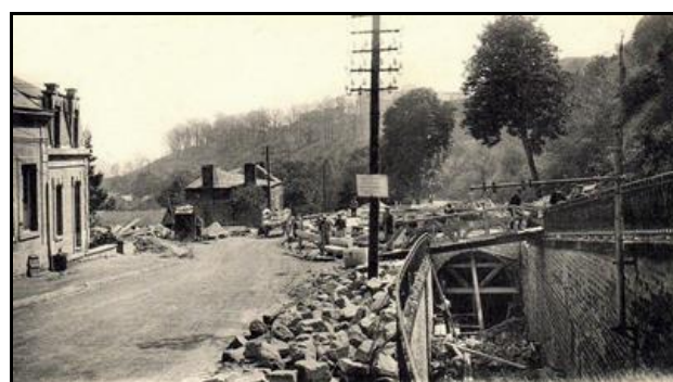
La reconstruction du tunnel, côté sortie, après la guerre