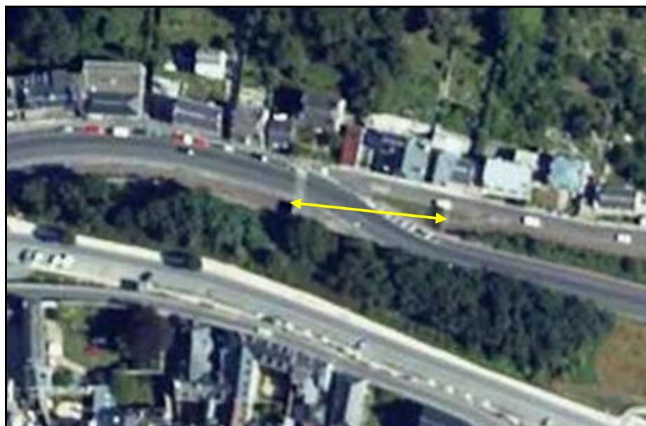
Vue aérienne de la galerie

Si cette fiche comporte des erreurs ou des oublis, merci de nous le signaler.