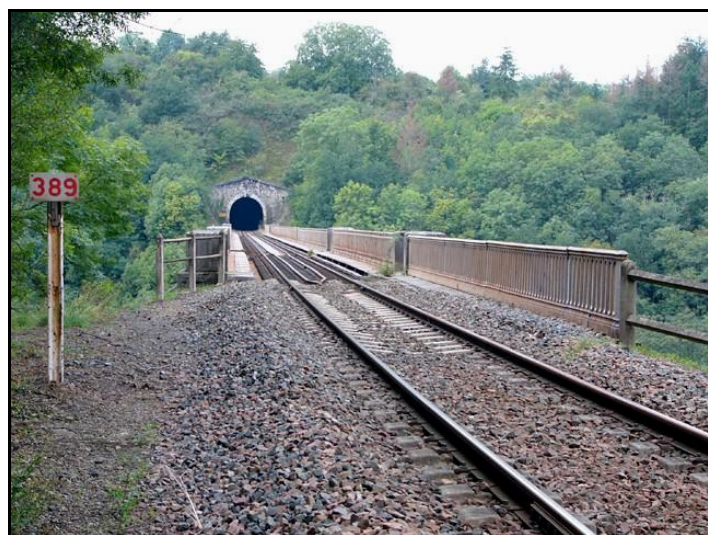
L'entrée du tunnel à l'extrémité ouest du viaduc de Neuvial

Si cette fiche comporte des erreurs ou des oublis, merci de nous le signaler.