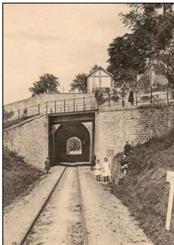
La sortie du tunnel du temps où la ligne était encore en service

Si cette fiche comporte des erreurs ou des oublis, merci de nous le signaler.