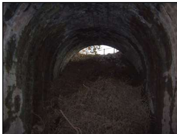
La galerie dont la sortie a été obstruée par un bouchon de terre