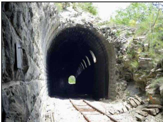
La fracture de la voûte est ici bien visible