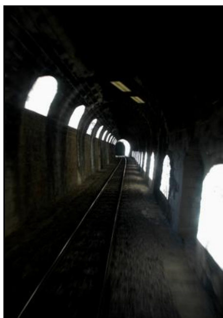
L'intérieur de la galerie avec ses 27 fenêtres Sur la photo de droite, au fond, la sortie du tunnel des Scaffarels