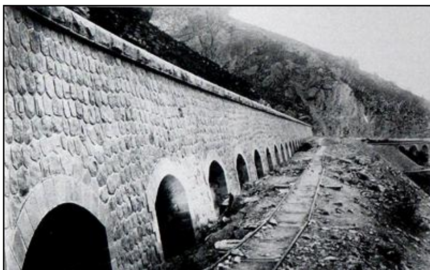
La galerie de protection des Scaffarels peu de temps après sa finition A sa droite, la petite voie de chantier qui a servi à la construire