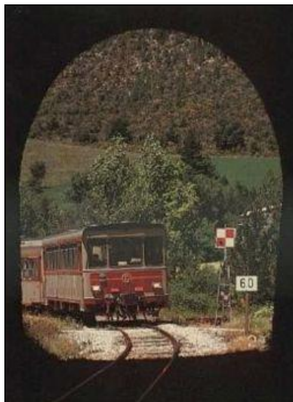
Deux autres vues de l'entrée du tunnel