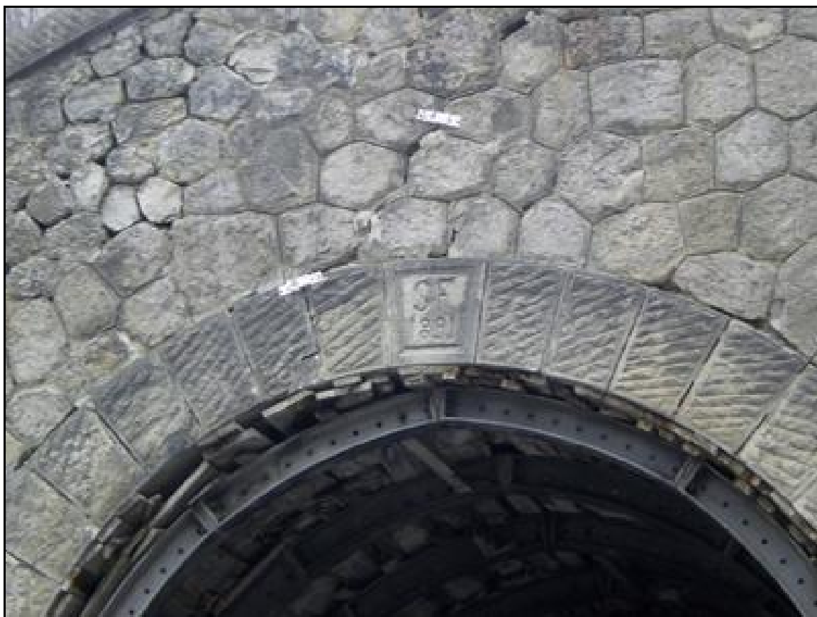
Gros plan sur le fronton de sortie Avec la date de construction du tunnel (1891) et la mention « SF » pour chemins de fer du Sud France

Si cette fiche comporte des erreurs ou des oublis, merci de nous le signaler.