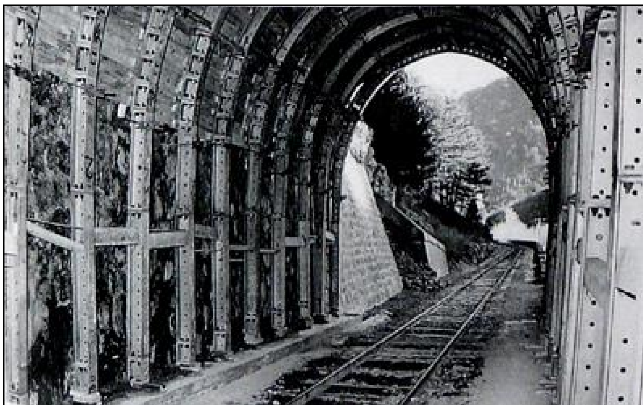
Gros plan sur les cintres de renfort posés près de la sortie