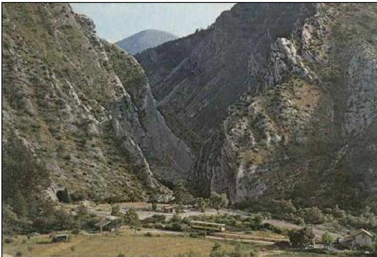
L'entrée du tunnel dans le cadre de la Clue de Chbrière