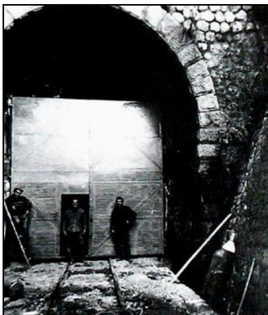
Travaux de pose de la porte d'entrée en 1968

Si cette fiche comporte des erreurs ou des oublis, merci de nous le signaler.