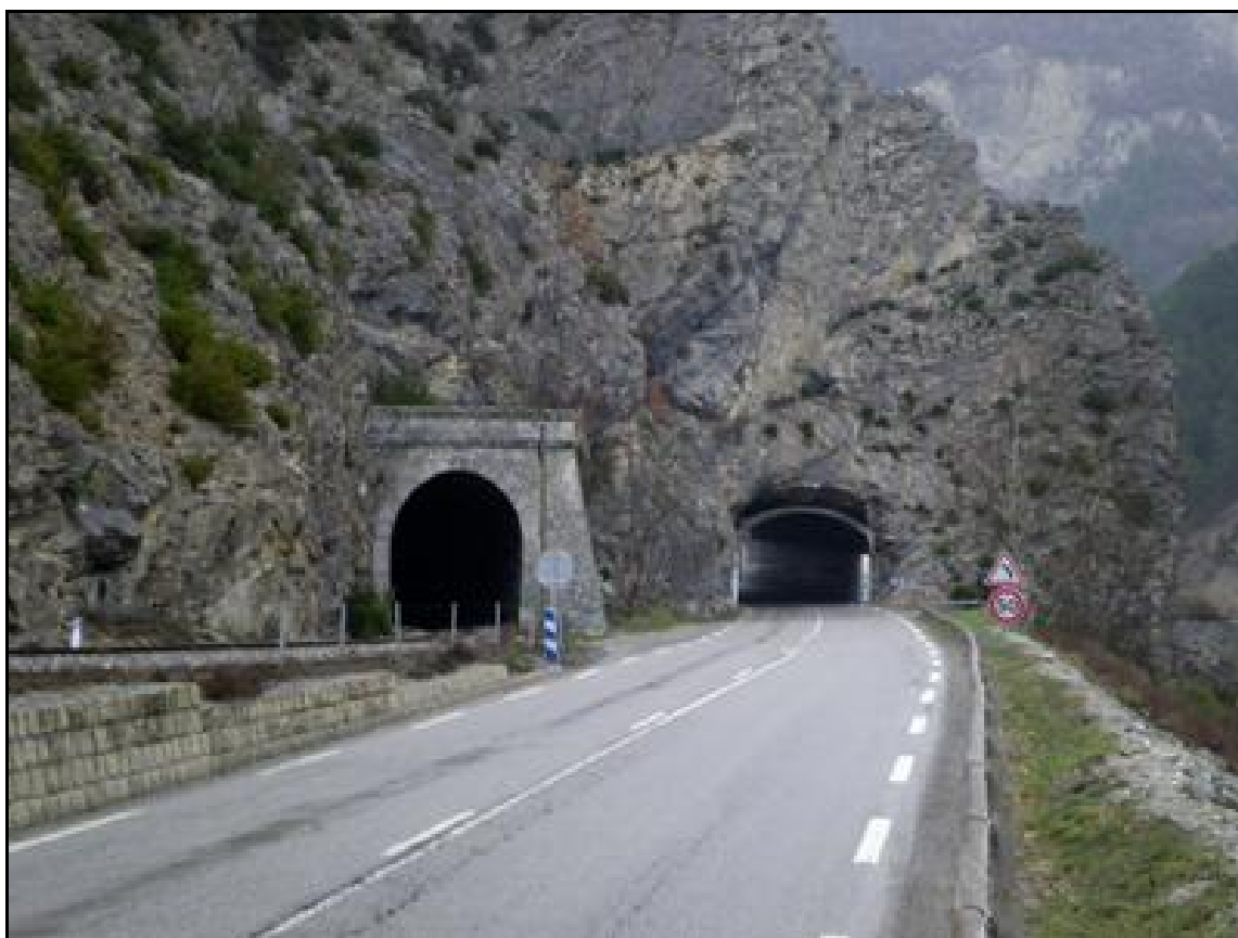
Et presque la même photo aujourd'hui Le tunnel routier a un peu changé

Si cette fiche comporte des erreurs ou des oublis, merci de nous le signaler.