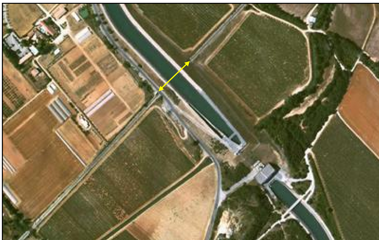
Vue aérienne de la galerie sous le canal de la Durance