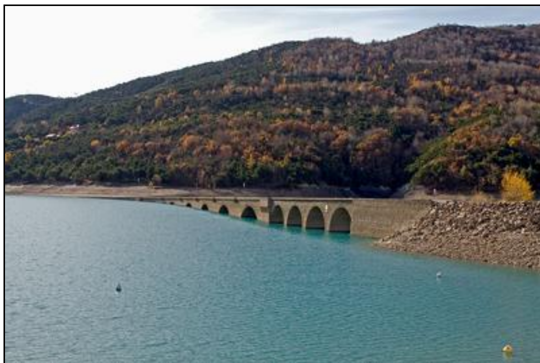
Le viaduc en S de Chanteloube, plus ou moins noyé dans le lac de Serre Ponçon

Si vous pouvez nous apporter des détails complémentaires, ou si cette notice comporte des erreurs, merci de nous le signaler.