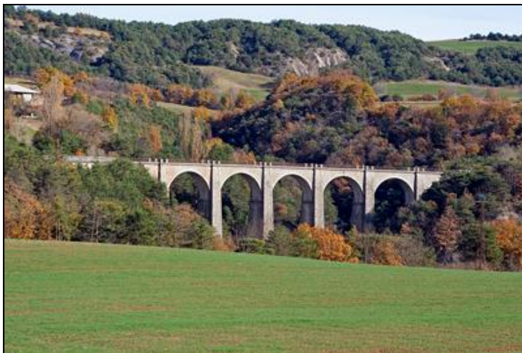
Le viaduc des Moulettes