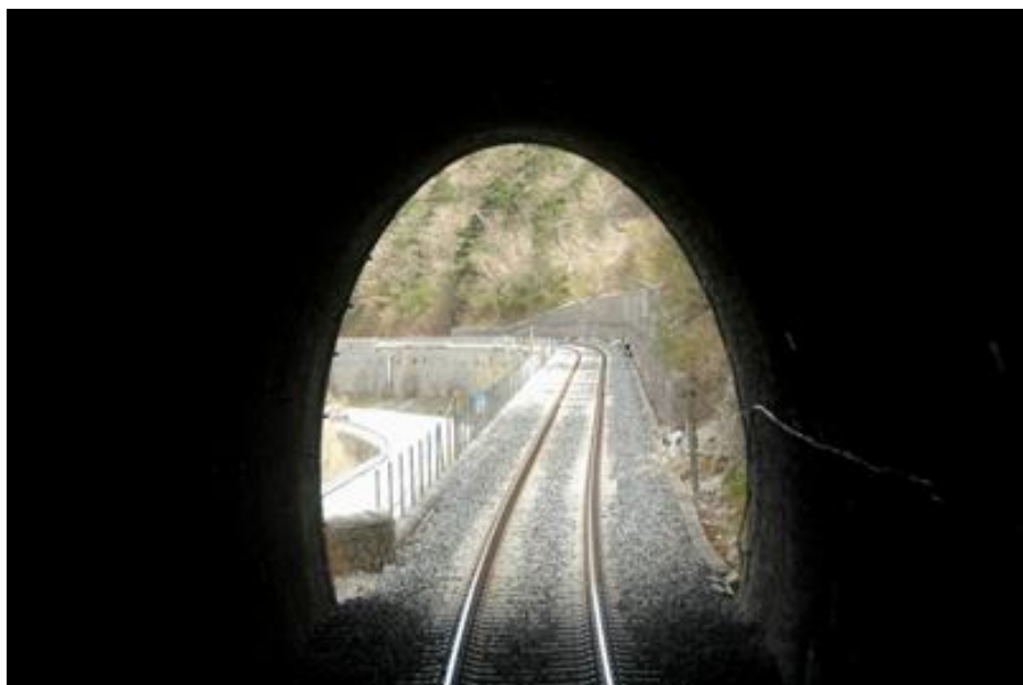
L'entrée du tunnel vue de l'intérieur

Si cette fiche comporte des erreurs ou des oublis, merci de nous le signaler.