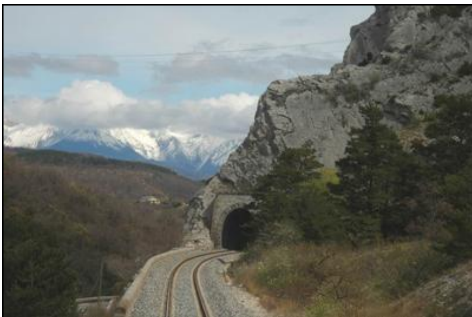
Le tunnel de Fontaine dans son magnifique cadre