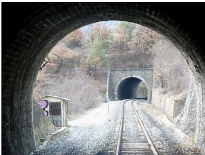
L'entrée du tunnel vue de l'intérieur avec le tunnel de Gorsas