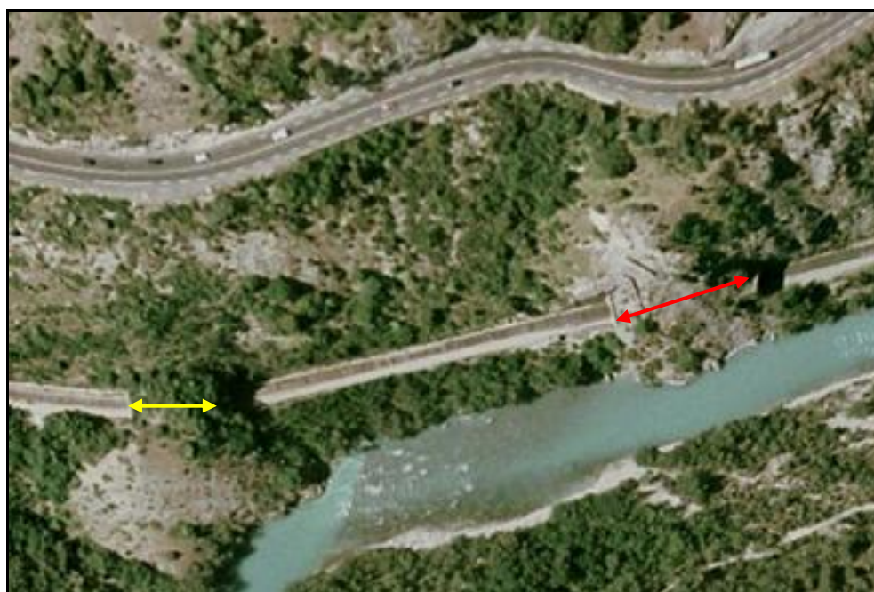
Vue aérienne des tunnels de Gorsas (à gauche) et de Serre de Buis (à droite) le long de la Durance

Si cette fiche comporte des erreurs ou des oublis, merci de nous le signaler.