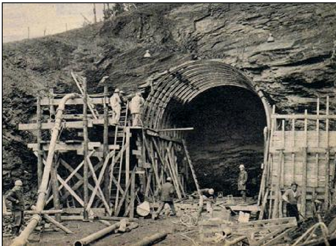
Une belle photo de la sortie du tunnel des Charrières en construction

Si cette fiche comporte des erreurs ou des oublis, merci de nous le signaler.