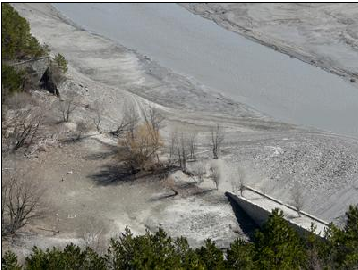
Gros plan sur l'entrée de l'ancien tunnel noyé des Champannes et d'un ancien pont ferroviaire qui le précédait