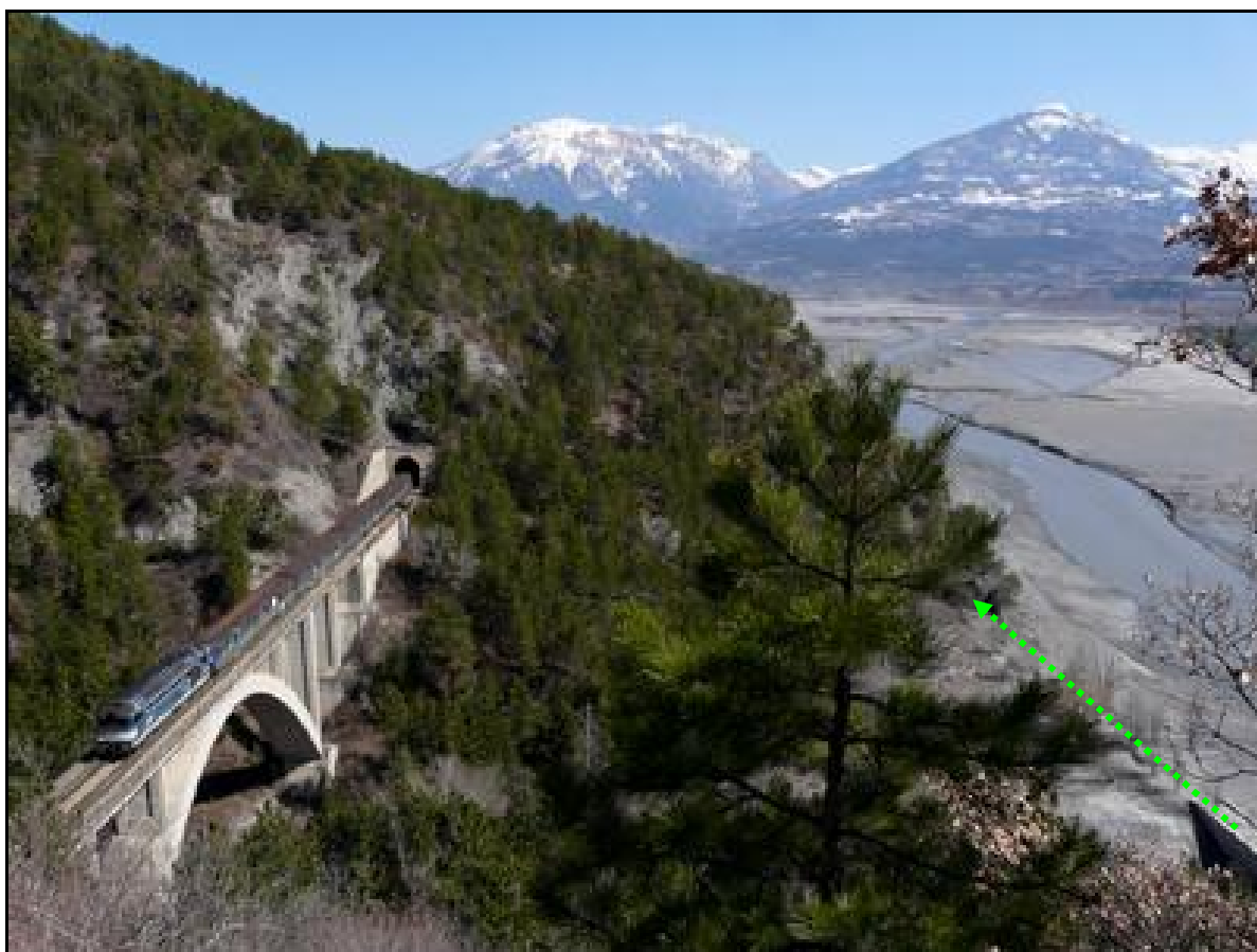
A gauche, l'entrée du tunnel du Villaret ; à droite (flèche verte), l'entrée du tunnel des Champannes