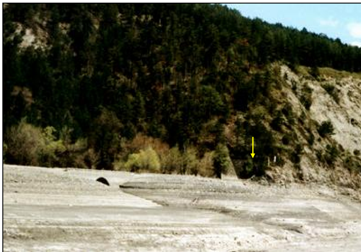
L'entrée vue depuis le lac