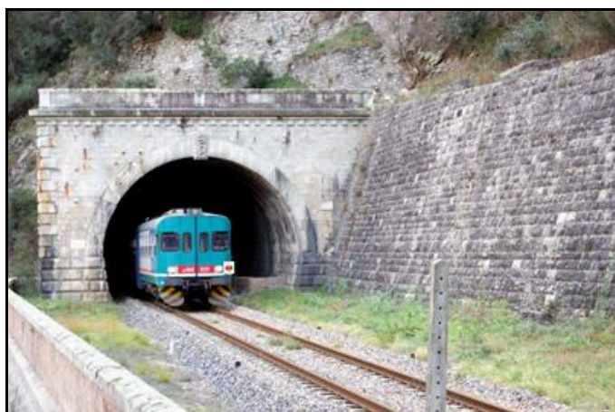
Un autorail italien s'engouffre dans l'entrée du tunnel