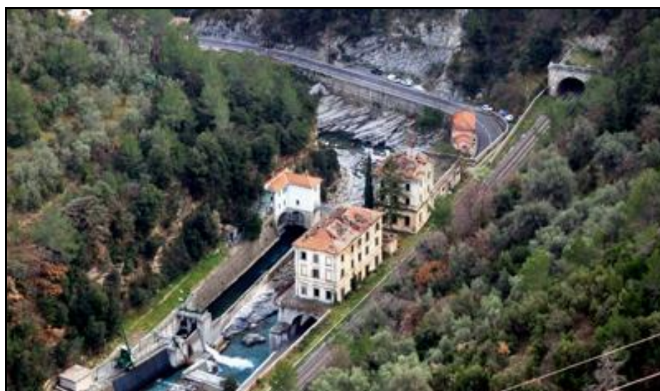
L'ancienne gare frontière de Piène Basse et l'entrée du tunnel