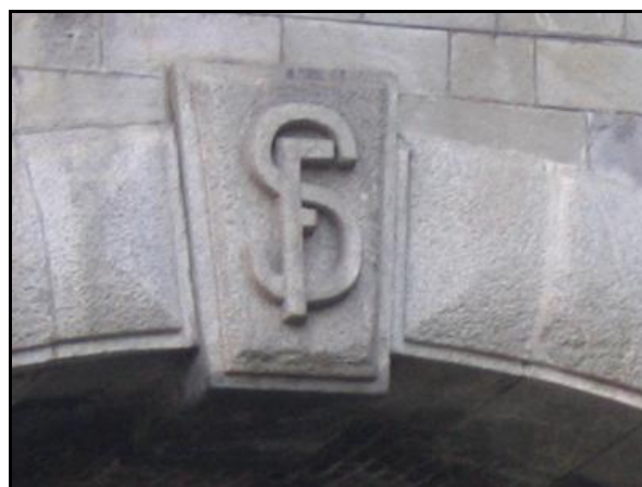
La ligne était initialement italienne comme en témoignent les frontons des ouvrages : FS – Ferro dello Stato