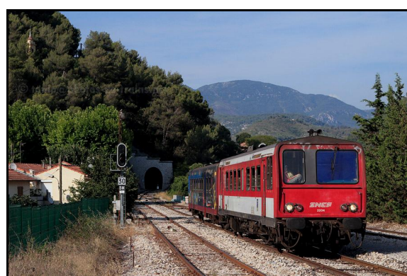
Ci-dessus et ci-dessous, divers types de matériels roulant sur cette ligne, sur fond de l'entrée du tunnel La rame en bas à droite est italienne et remonte vers Cunéo