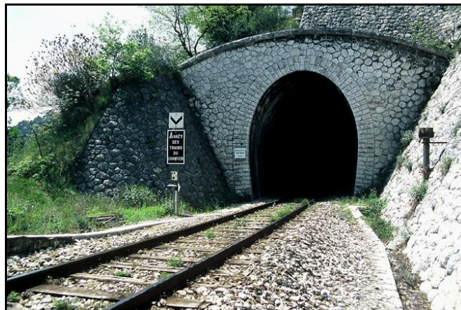
L'entrée du tunnel en sortie de gare de Drap et Cantaron