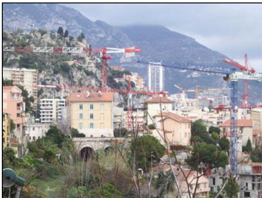
L'entrée des deux galeries dans le tissu urbain de Monaco

Si cette fiche comporte des erreurs ou des oublis, merci de nous le signaler.