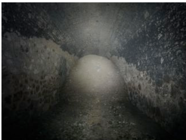
L'entrée complètement obstruée