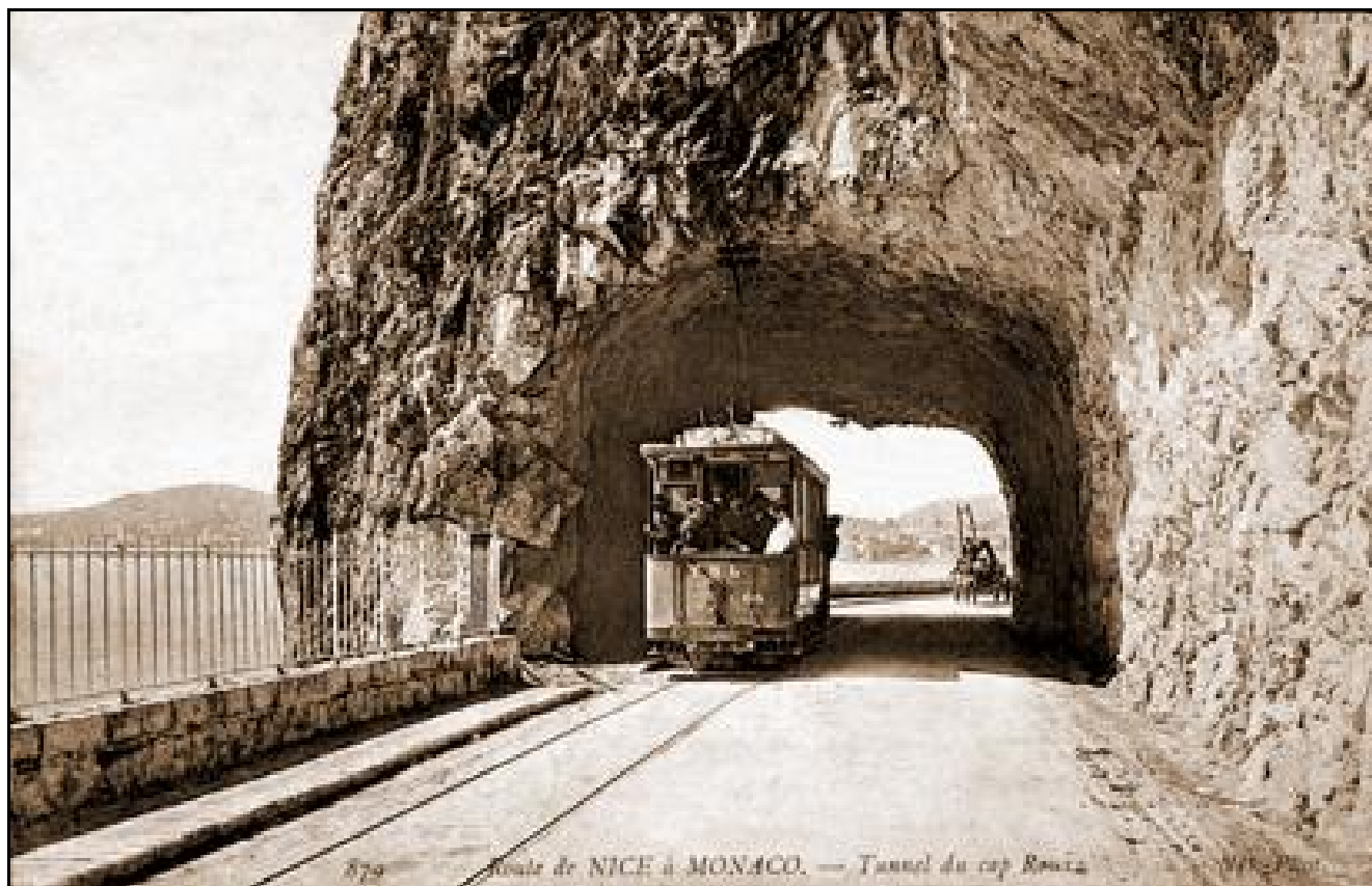
Ci-dessus et ci-dessous, cartes postales d'époque montrant l'entrée et la sortie du tunnel prises depuis l'intérieur de la galerie