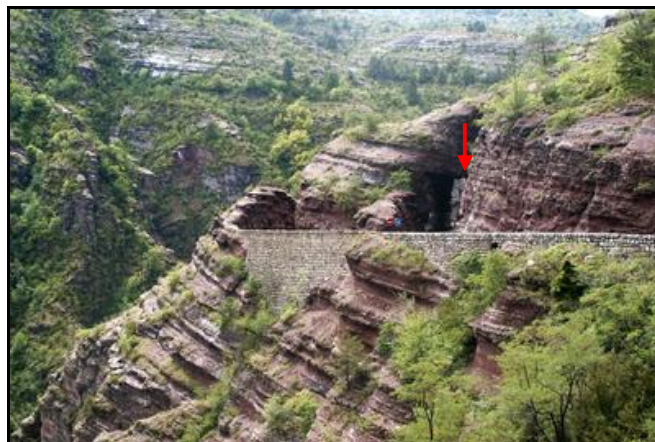
La sortie du tunnel

Si cette fiche comporte des erreurs ou des oublis, merci de nous le signaler.