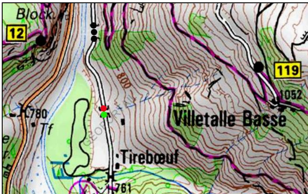
Les points noirs indiquent le tunnel voisin de la Traverse, n° 06071.21