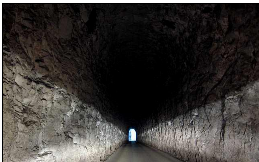
L'intérieur de la galerie en roche vive

Si cette fiche comporte des erreurs ou des oublis, merci de nous le signaler.