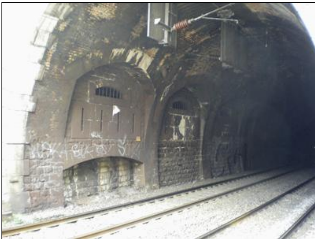
Autre vue en gros plan sur le système de défense de la sortie