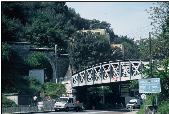
Autres vue de l'accident, du pont et de la sortie du tunnel

Si cette fiche comporte des erreurs ou des oublis, merci de nous le signaler.