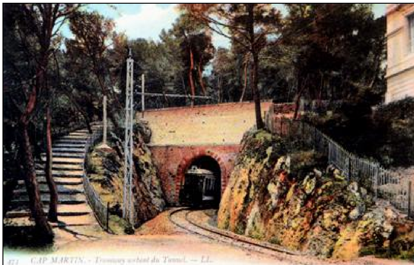
Carte postale colorisée d'époque montrant le Tramway Nice Littoral sortant du tunnel de Cap Martin