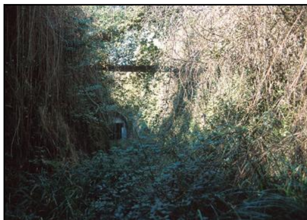
L'entrée et la sortie rendue inaccessible par les ronces

Si cette fiche comporte des erreurs ou des oublis, merci de nous le signaler.