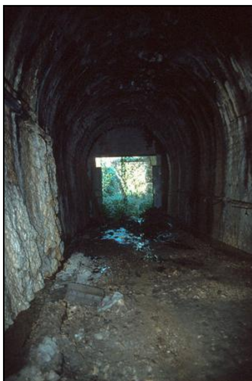
La sortie, très humide, vue de l'intérieur