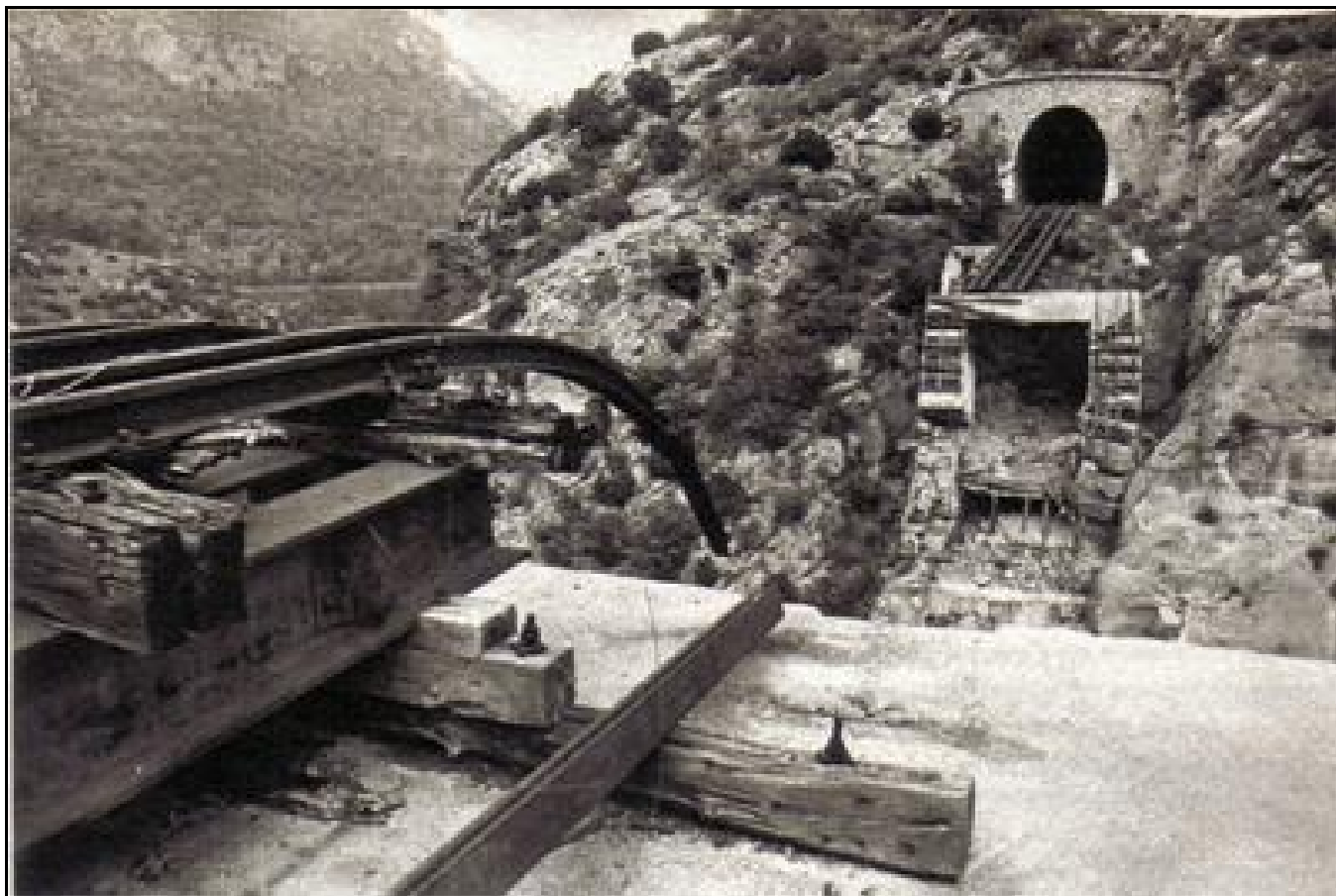
Ci-dessus et ci-dessous, trois photos montrant la sortie du tunnel de Nocé à côté du viaduc de Saorge détruit pendant la guerre et avant reconstruction