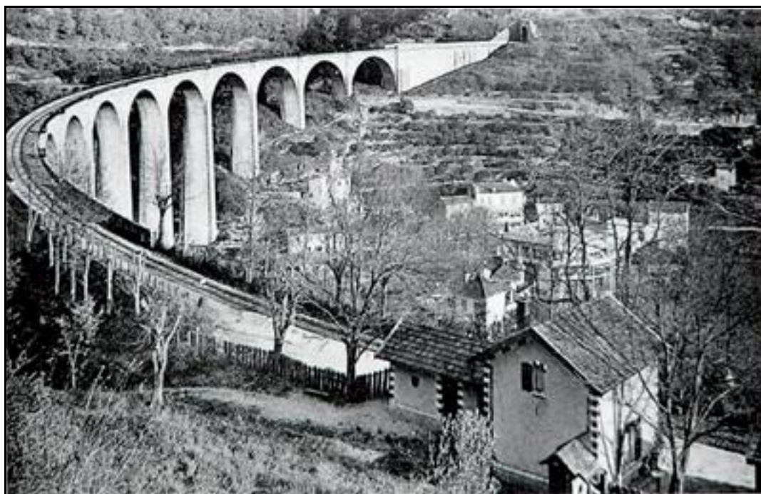
Ci-dessus et ci-dessous, le viaduc du Pont du Loup et l'entrée du tunnel, à l'époque et aujourd'hui