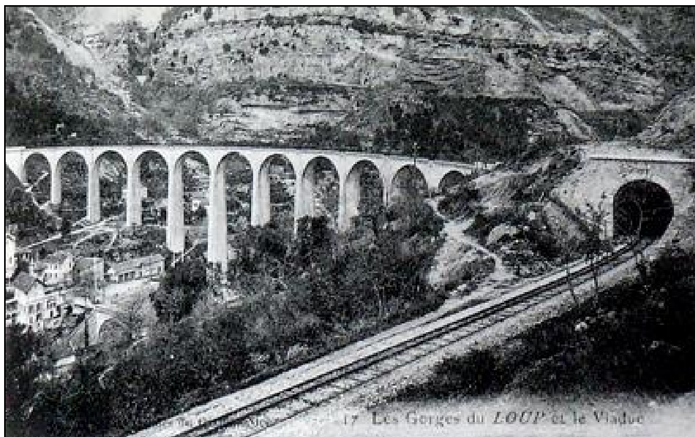
Le viaduc et la sortie du tunnel du Loup

Si cette fiche comporte des erreurs ou des oublis, merci de nous le signaler.