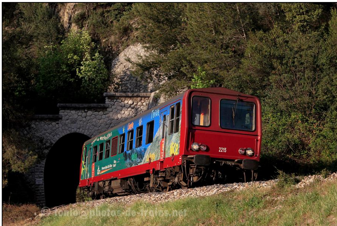
Autorail montant vers Breil sur Roya, au sortir du tunnel de Serradone

Si cette fiche comporte des erreurs ou des oublis, merci de nous le signaler.