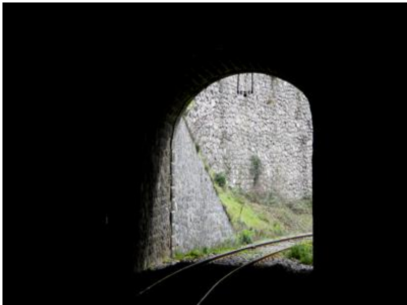
La sortie vue de l'intérieur Un support de l'ancien câble trolley est bien visible au milieu de la voûte