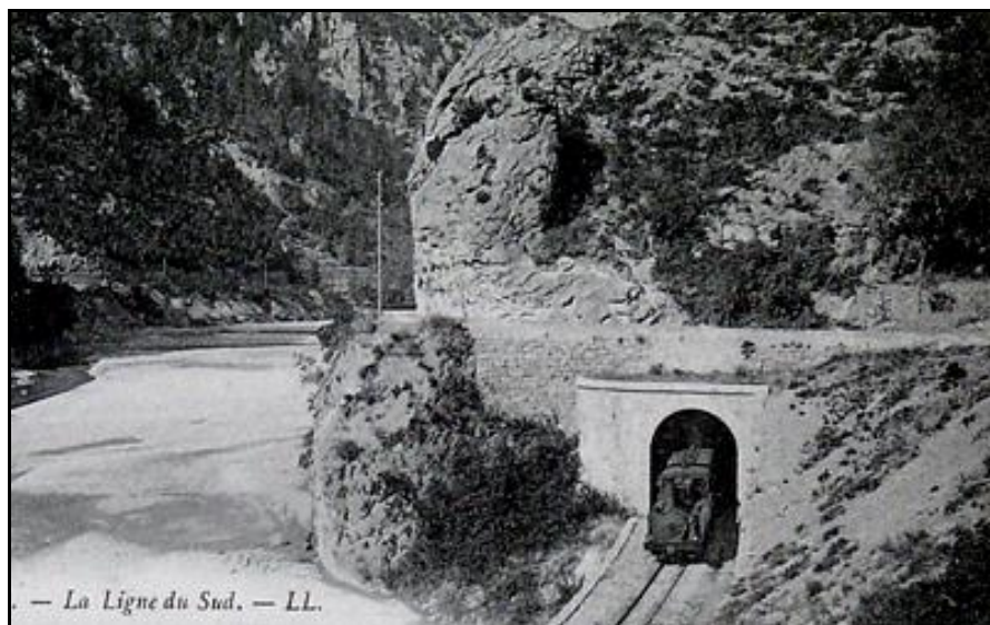
La sortie du temps de la vapeur alors que le tunnel routier n'est pas encore réalisé