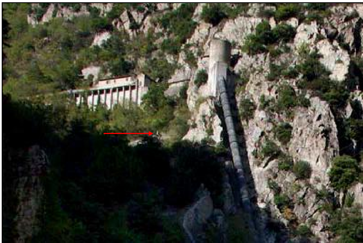
La tour de la cheminée d'équilibre vue sous un autre angle La flèche rouge indique la position de l'entrée du tunnel

Si cette fiche comporte des erreurs ou des oublis, merci de nous le signaler.