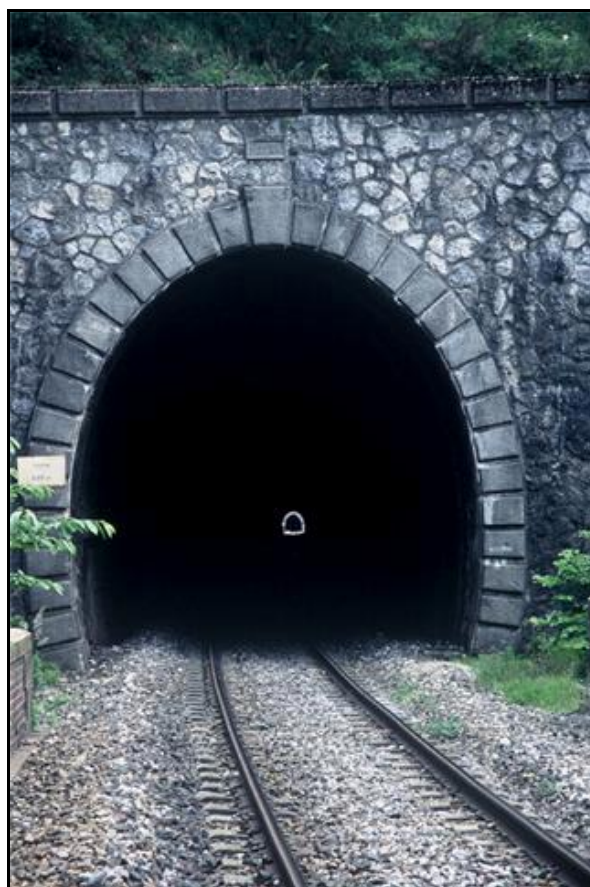
Tout au fond, à travers le tunnel de Frera, la sortie du tunnel de Rio Freddo

Si cette fiche comporte des erreurs ou des oublis, merci de nous le signaler.