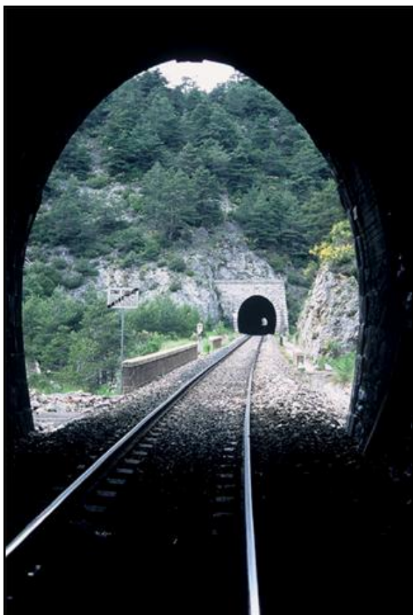
L'entrée du tunnel de Frera vue depuis la sortie du tunnel de Rio Freddo