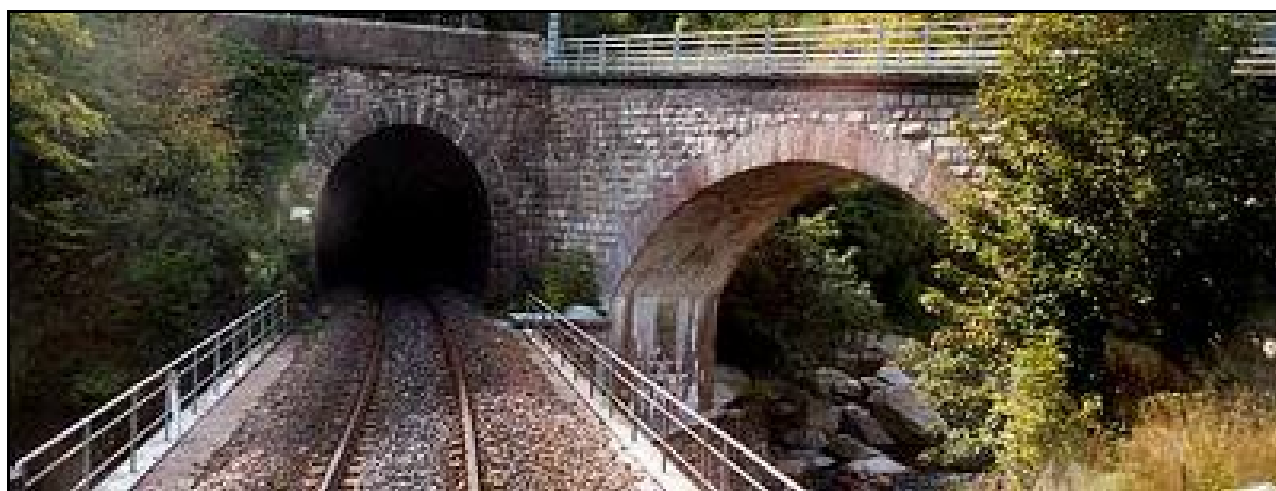
Autre vue de la sortie du tunnel

Si cette fiche comporte des erreurs ou des oublis, merci de nous le signaler.