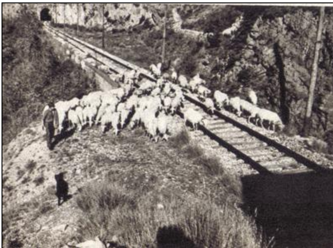
Dans le fond, l'entrée du tunnel de Bijorin après guerre et avant remise en état de la ligne Au premier plan à droite, l'ombre du fronton de la sortie du tunnel de Colombera

Si cette fiche comporte des erreurs ou des oublis, merci de nous le signaler.