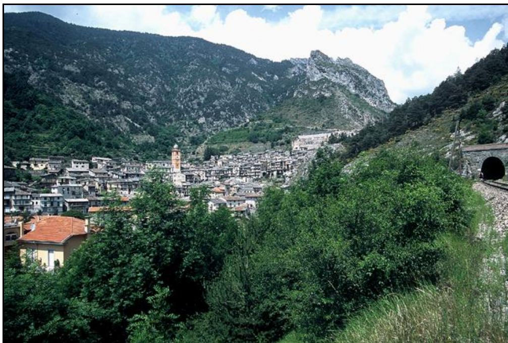
Tende et l'entrée du tunnel

Si cette fiche comporte des erreurs ou des oublis, merci de nous le signaler.