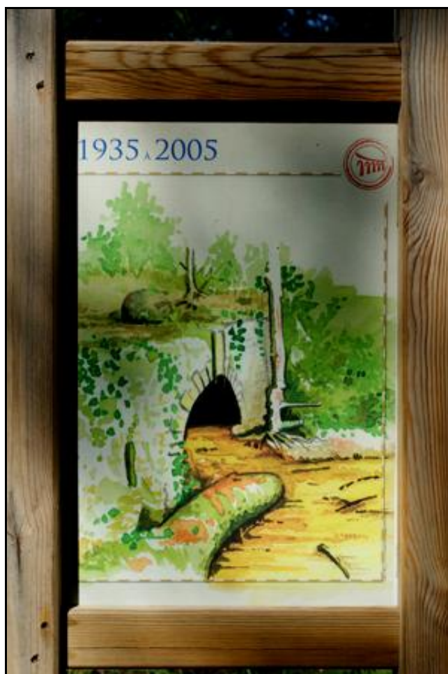
Date de percement portée au fronton de la galerie : 1878 Et représentation d'un panneau d'information du sentier de randonnée qui fait le tour du site