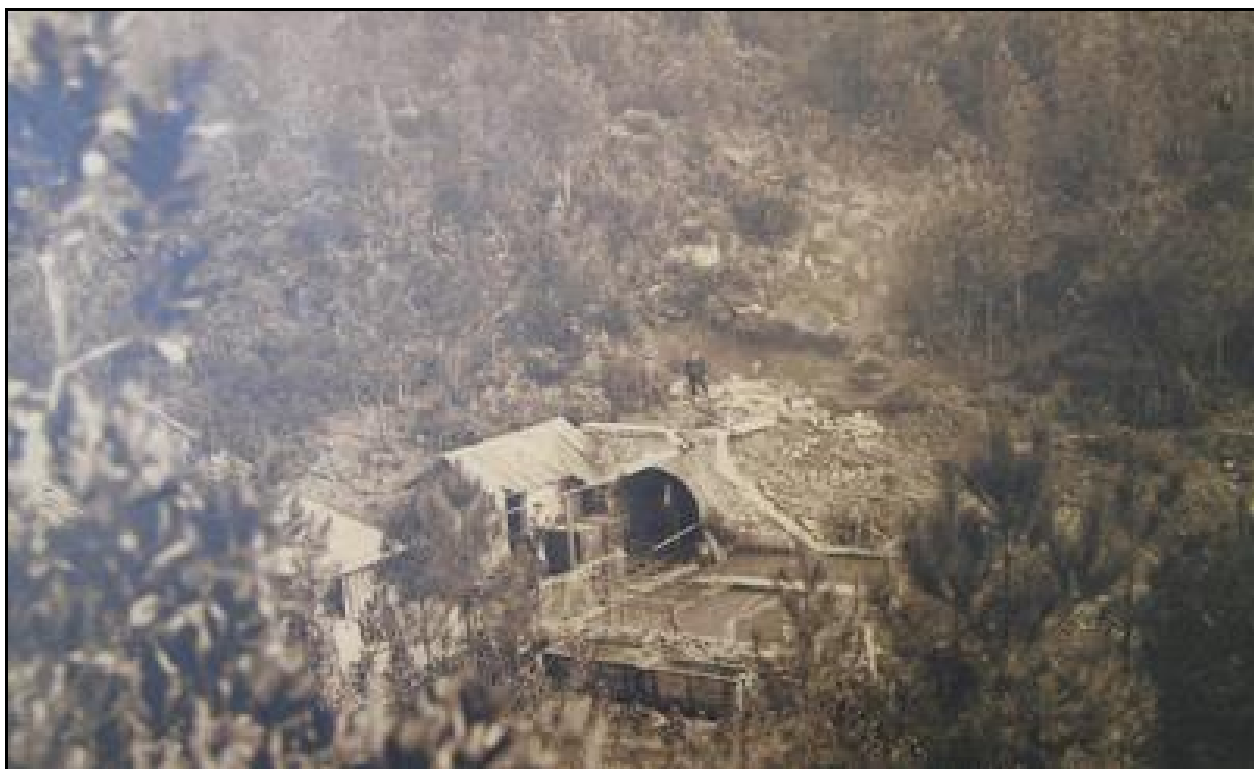
Belle photo ancienne montrant l'entrée de la galerie alors en service