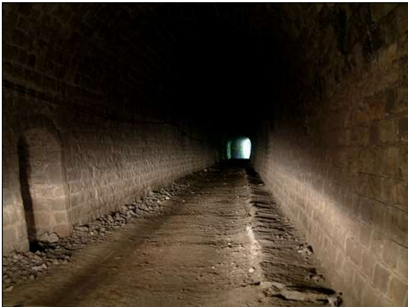
Ci-dessus et ci-dessous, deux vues de l'intérieur de la galerie