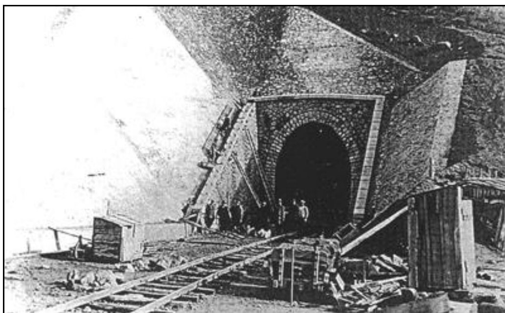
La sortie à l'époque des travaux. La voie est celle du chantier