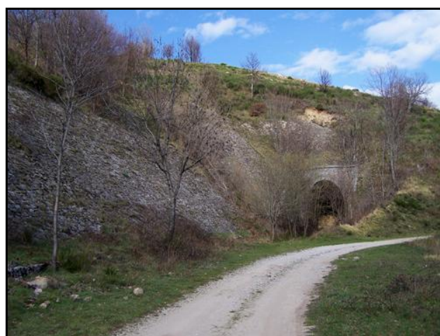
Deux autres photos de l'entrée et de la sortie dans l'état actuel La piste contourne aujourd'hui le tunnel

Si cette fiche comporte des erreurs ou des oublis, merci de nous le signaler.