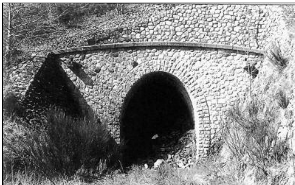
Et l'entrée peu après le premier éboulement