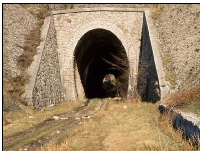
L'entrée et la sortie du tunnel avant qu'il ne s'éboule et à l'époque où le chemin passait dedans