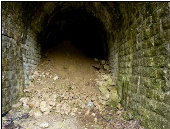
Les deux éboulements, à l'entrée et à la sortie