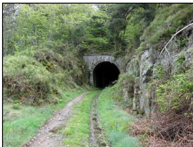
L'entrée et la sortie