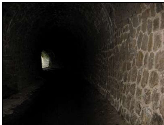
Deux autres photos de l'intérieur de la galerie