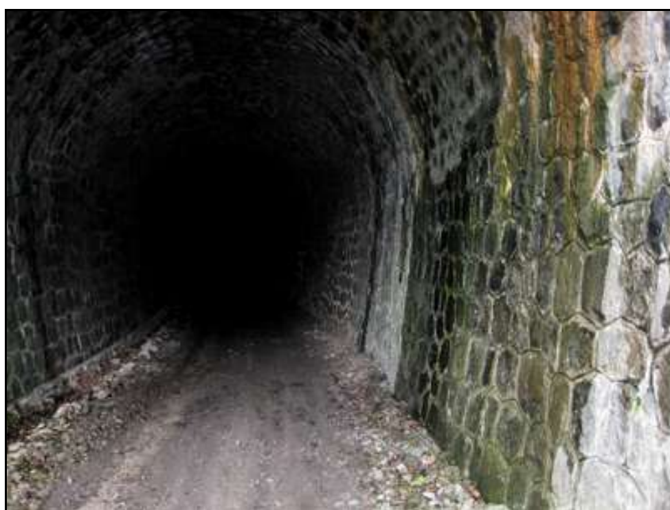
La galerie, en excellent état