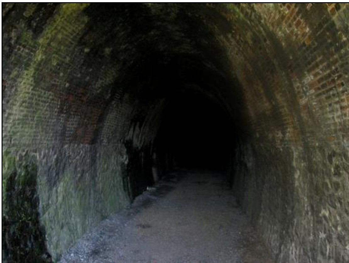
Ci-dessus et ci-dessous, la belle galerie du tunnel