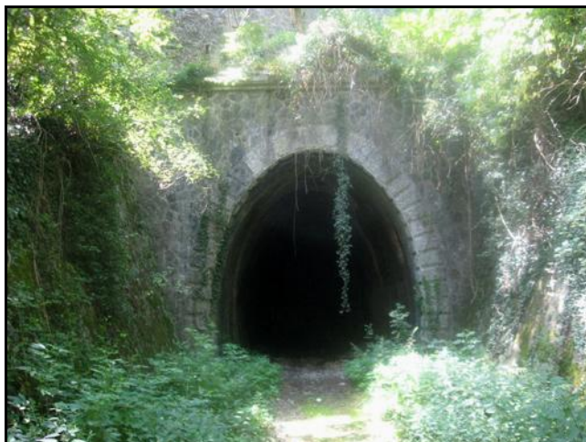
Ci-dessus et ci-dessous, le tunnel du temps où il était abandonné et obstrué par des pierres