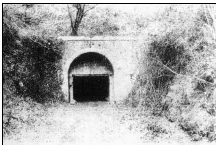
L'entrée du tunnel du temps de la construction

Si cette fiche comporte des erreurs ou des oublis, merci de nous le signaler.