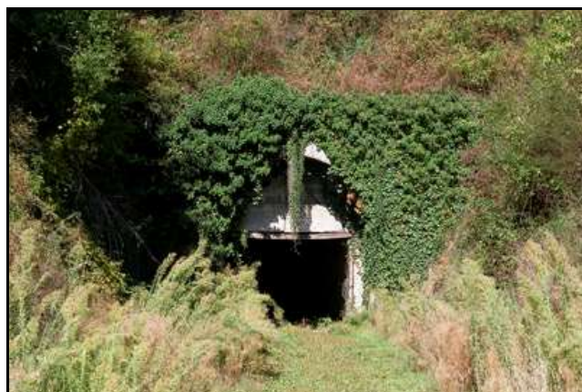
L'entrée et la sortie du tunnel quelques années en arrière