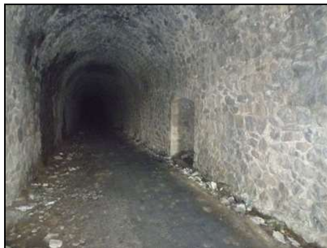
Ci-dessus et ci-dessous, quatre aspects de la galerie